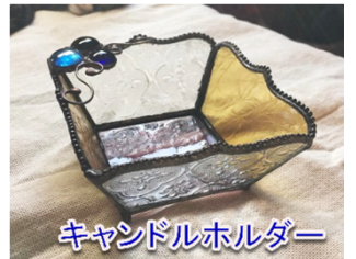
キャンドルホルダー